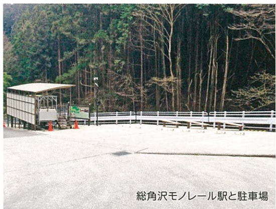
総角沢モノレール駅と駐車場

小林家住宅管理棟 Tel.090-5543-0750 受付時間 開館日の9:30～16:00 ※冬期間は15:00