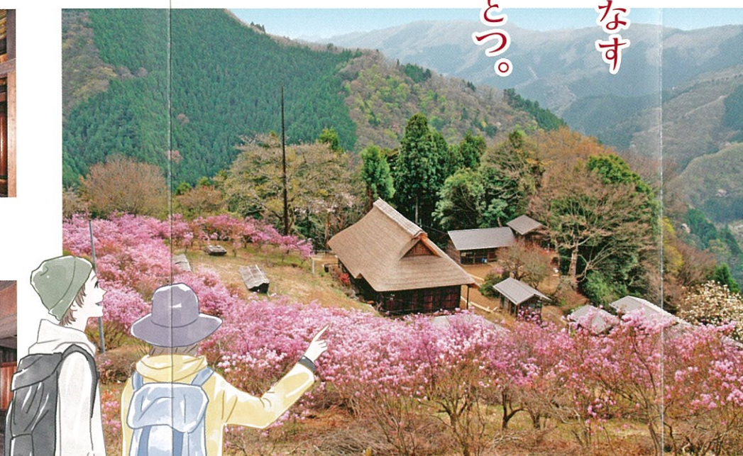
⑤ つつじ公園からの景観